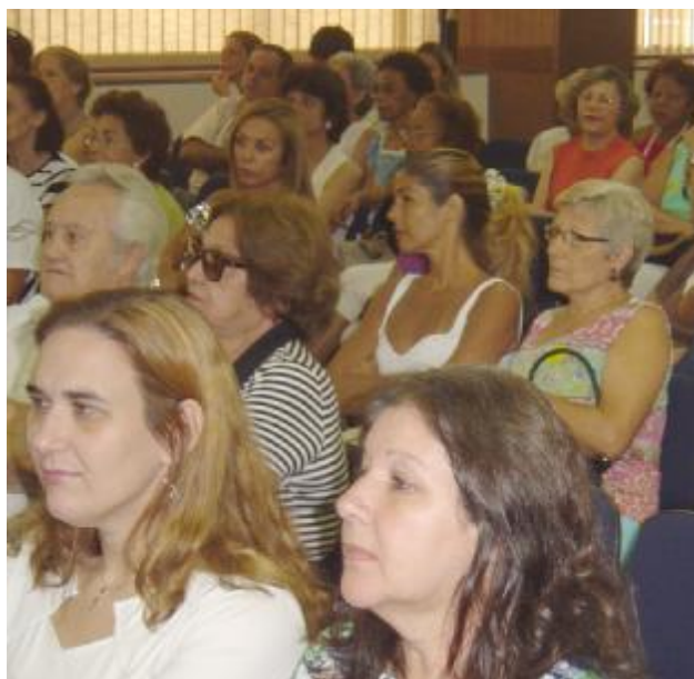
Encontro reuniu cerca de 400 usuários no Rio de Janeiro