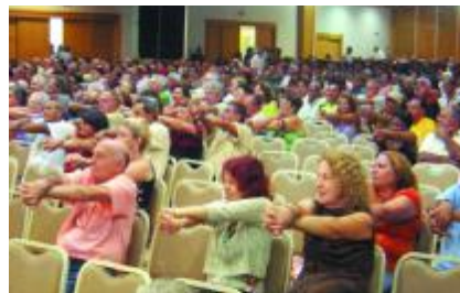
Encontro de Aposentados em Vitória

duração do encontro e aumentar o espaço físico em que ele é realizado. Em Vitória, 89% consideraram as apresentações boas ou ótimas e 100% aprovaram a escolha do local. Entre as considerações para melhorias, foram citadas a necessidade de maior divulgação e a criação de um calendário de programação para quem mora mais longe.